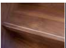
タイムウォールナット柄 (TNT)