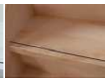
ラスターメープル柄 (LMP)