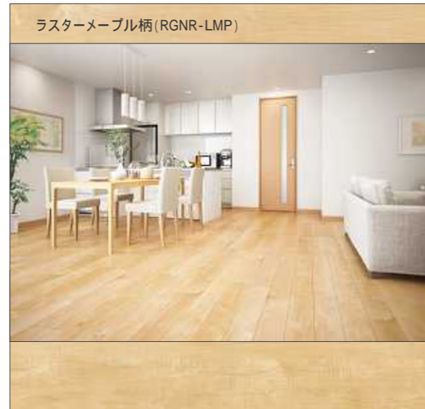
ラスターメープル柄 (RGNR-LMP)