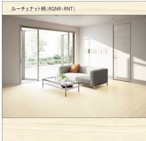
ルーチェナット柄 (RGNR-RNT)