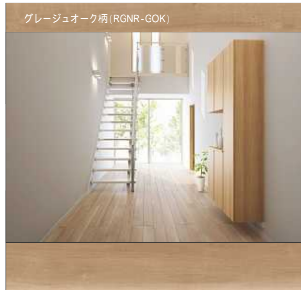
グレイジュオーク柄 (RGNR-GOK)