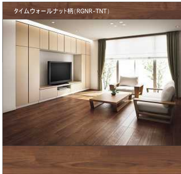
タイムウォールナット柄 (RGNR-TNT)