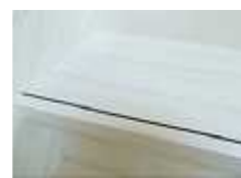
ルーチェナット柄 (RNT)

TNT, CZBは、ライトグレー色の段鼻樹脂。 RNT, LMP, SOK, RCH, GOKは、ダークグレー色の段鼻樹脂。