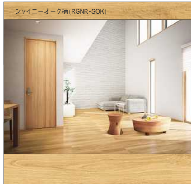
シャイニーオーク柄 (RGNR-SOK)