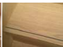
シャイニーオーク柄 (SOK)