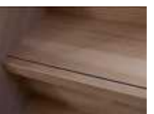
グレイジュオーク柄 (GOK)