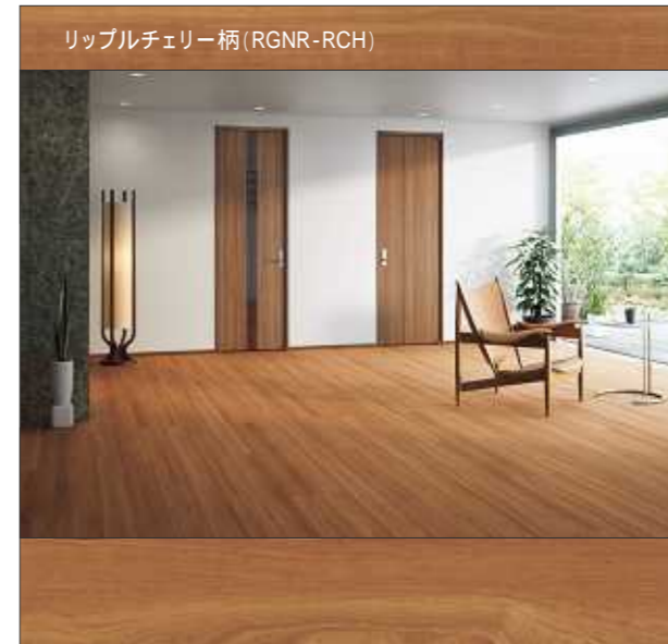
リップルチェリー柄 (RGNR-RCH)