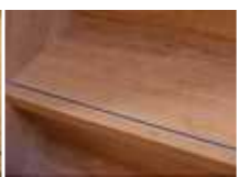
リップルチェリー柄 (RCH)